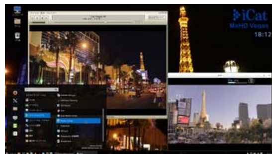
MsHD-Vegas 4K Video